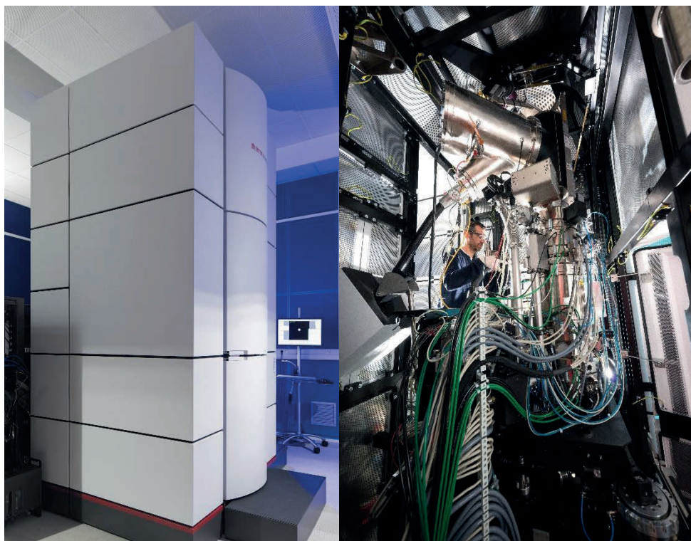
Partie haute du microscope électronique en transmission dans son enceinte acoustique

L'inauguration du microscope Nant'Themis aura lieu le jeudi 7 février 2019 au sein de l'Institut des matériaux Jean Rouxel (IMN- CNRS/Université de Nantes). Instrument unique par certains aspects au niveau national voire mondial, ce microscope génère déjà des images et des analyses de la matière à l'échelle atomique, et de très haute qualité. Il va permettre de caractériser des échantillons développés pour des applications très diverses comme l'énergie, la santé, les bio-ressources, l'électronique etc. Un futur microscope très interdisciplinaire !